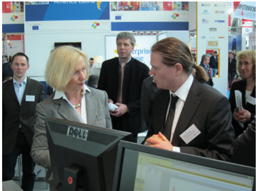
1 Wissenschaftsministerin Wanka informiert sich über das OptiNum-Grid-Projekt

Von besonderer Bedeutung sind die Beispielanwendungen des Projektes. Ein im Projekt demonstriertes Anwendungsszenario ist die Simulation von Elektronenstrahlbelichtungen. Bei dieser rechenintensiven Anwendung wird das Ergebnis einer Belichtung si-